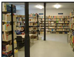
Bibliothek der FSP2 1