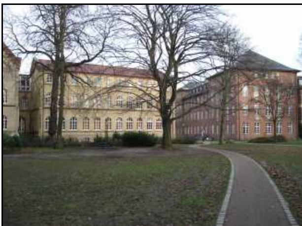
Die FSP2 ist auf dem Weg ...