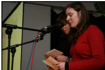
FSP2 / Haus 7 am 31. Januar 2007