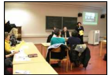
Universität Hamburg am 22. Januar 2008