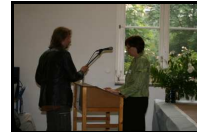
am 6. Juni 2007