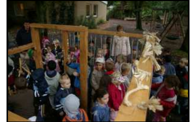
In einer Kita in Hamburg