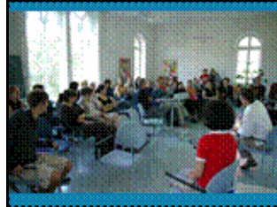
Begrüßung der tschechischen Gäste in der FSP2