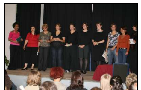
FSP2 / Haus 7 am 6. Juni 2007