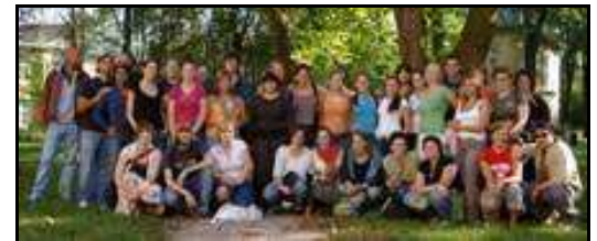
Die erste interclass der FSP2