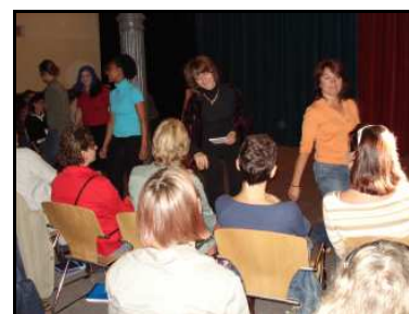
Im „Kolibri“ am 22. Juni 2007