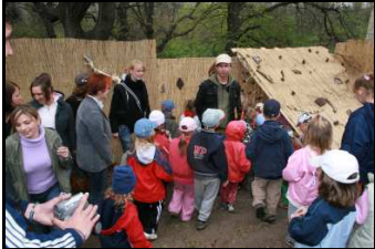
In einer Kita in Prag