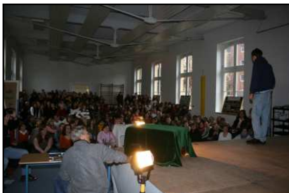
FSP2 / Haus 7 am 31. Januar 2007