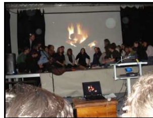
FSP2 / Haus 7 am 31. Januar 2008